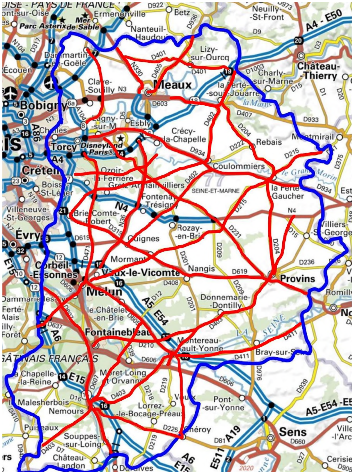
Carte des voies

Les 20 voies où ont été observés les plus grands nombres de tués, représentant seulement 15% de la longueur totale des routes sans séparateurs médian, concentrent 490% des tués.